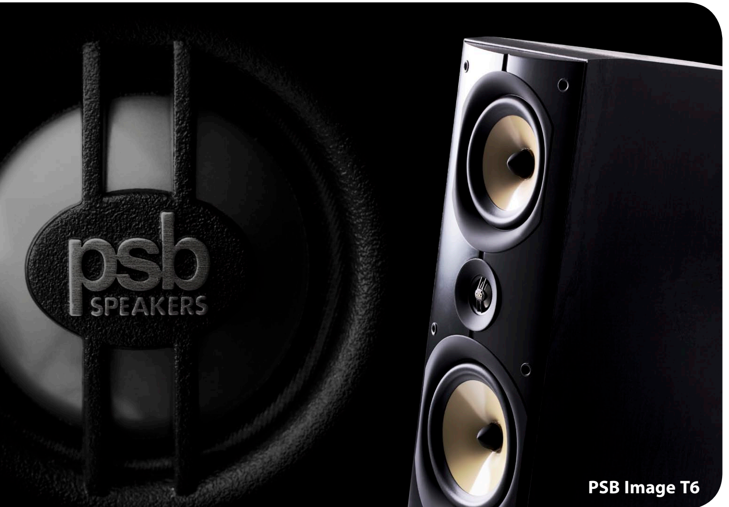
PSB Image T6