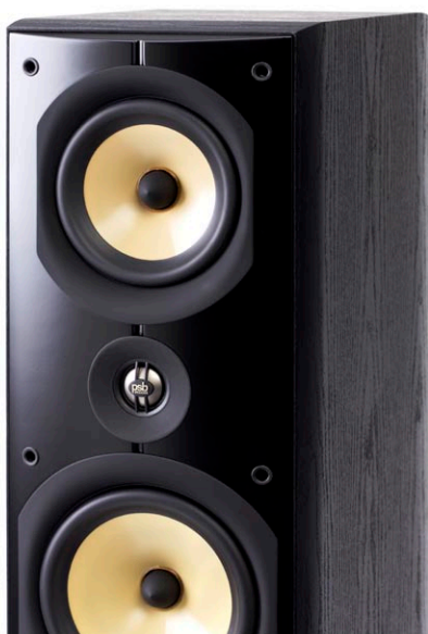
Der Mitteltöner residiert ganz oben an der Schallwand in seiner eigenen Kammer, darunter befindet sich der Hochtöner in Sitz-Ohrhöhe

Ganz oben in der aus Kunststoff gefertigten Schallwand der T6 befindet sich der Mitteltöner, darunter günstig in Ohrhöhe sitzenden Auditoriums platziert der Hochtöner; dann folgen abwechselnd die Tieftöner und Bassreflex-Öffnungen. Die Membrane der Mittel- und Tieftöner werden aus einem Verbund von Polypropylen und Keramik hergestellt, um durch die Kombination der jeweiligen Materialeigenschaften ein optimales Verhältnis von geringem Gewicht und hoher Verwindungssteifigkeit zu erzielen.