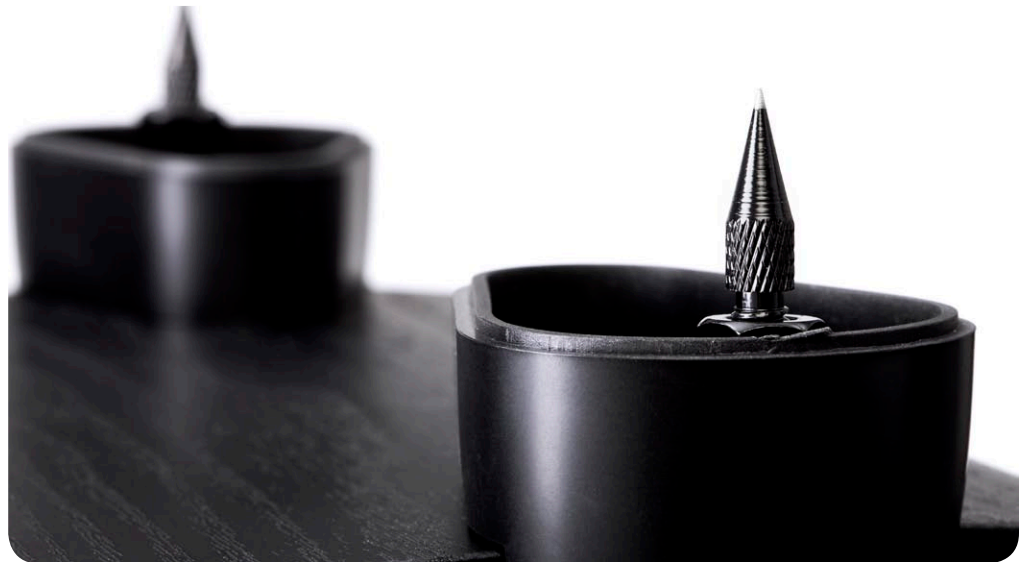
Die Umschalungen der Spikeaufnahmen sind zwar aus Kunststoff, aber wo es klanglich darauf ankommt, ist alles grundsollide: Die Spikes drehen präzise und sitzen fest

Von der neuen Image-Serie sagt Paul Barton, mit ihr habe er das Verhältnis von Klanggüte und Preis seiner Lautsprecher weiter perfektionieren können. Die T6 ist der größte Standlautsprecher aus der neu aufgelegten Image-Serie, er ist als klassisches Drei-Wege-Design mit vier Treibern konzipiert. Für die Wiedergabe hoher Frequenzen wird eine fünfundzwanzig Millimeter durchmessende Kalotte aus Titan eingesetzt, die ab 2,2 Kilohertz ihre Arbeit aufnimmt. Unterhalb dieser Übergabefrequenz spielt der 130mm-Mitteltöner herab bis 500 Hertz, gut geschützt vor den Luftströmungen im Gehäuseinneren durch eine eigene Gehäusekammer. Die Ventilation der zwei stattlichen 165mm-Tieftöner wird über zwei Bassreflex-Öffnungen abgeführt, die jeweils frontseitig direkt unterhalb der Tieftonchassis positioniert sind.